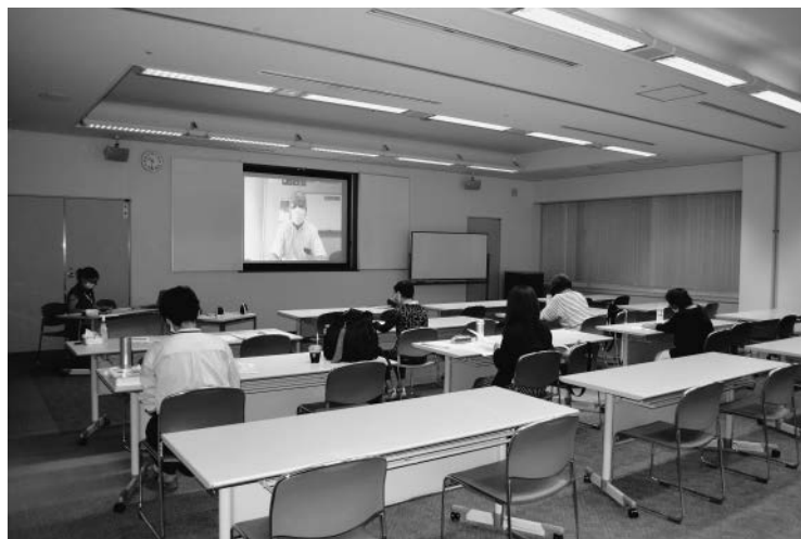
一部参加者は会場で講義を受講

第2回：10月14日(水)「購買生協の会計・決算書類の見方・経営分析」、第3回：10月21日(水)「コロナ禍における医療生協の経営状況と、理事・監事の役割について」もオンラインで実施します。