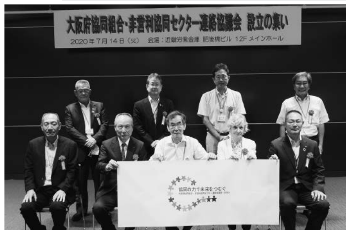
大阪府協同組合・非営利協同セクター連絡協議会設立の集い