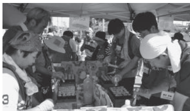
一生懸命焼きました

翌日19日(月)は、ボランティアで、南三陸町の震災遺構、石巻市の旧大川小学校跡地、女川町などを視察しました。