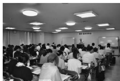
65名が参加しました