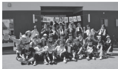
主催・協力団体の集合写真