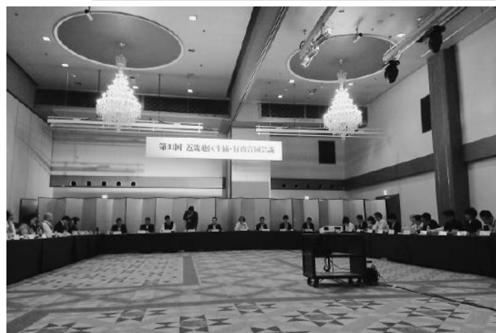
第31回近畿地区生協・行政合同会議