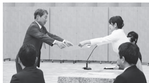
〈大臣より表彰される惣宇利会長〉