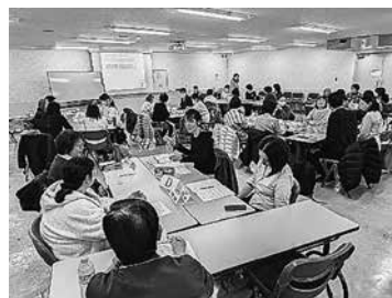
講演と会場の様子