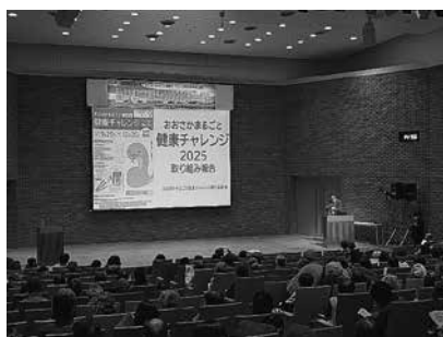
健康チャレンジまとめ報告