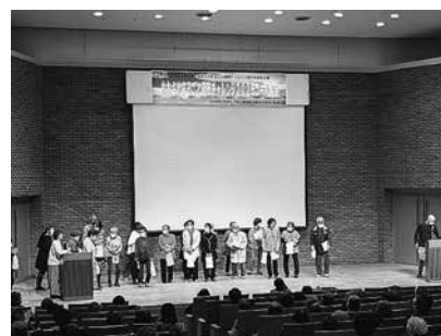
最後は、お楽しみ抽選会により20名の方が当選されました