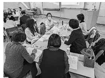
グループでは楽しく 意見交流しました