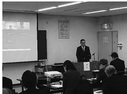
開会挨拶 農林水産省近畿農政局 志知雄一局長