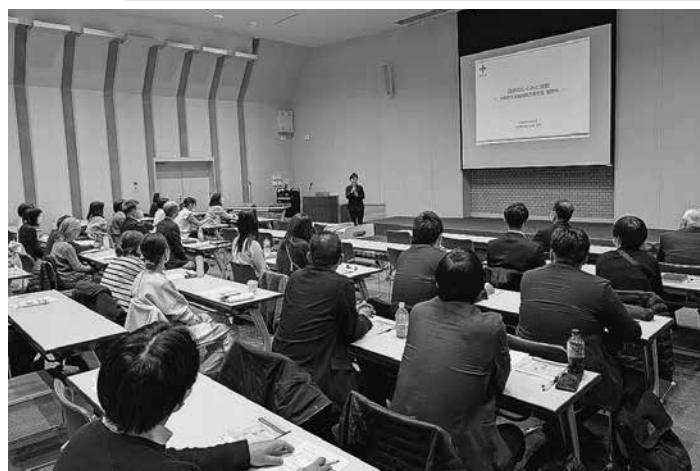
平和に関する学習会「ガザ地区での支援活動と現状」