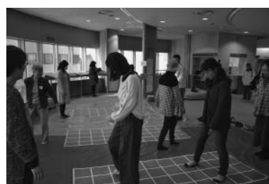
スクエアステップ体験