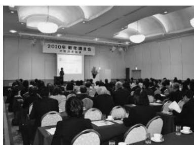
色々な生協の人でグループ感想交流