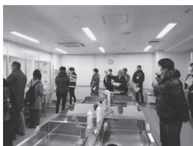
小名浜魚市場モニタリング室