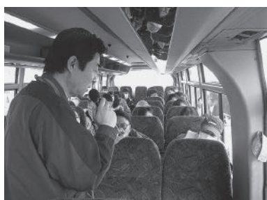
バスで第一原発の見学