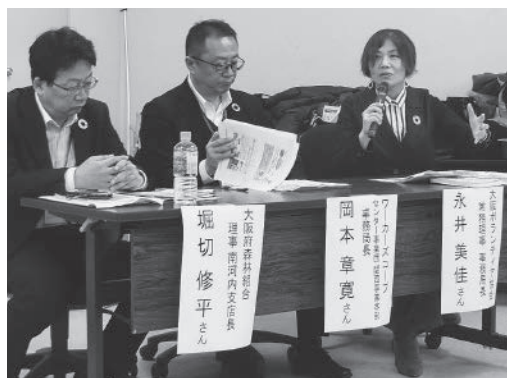
団体リレートーク