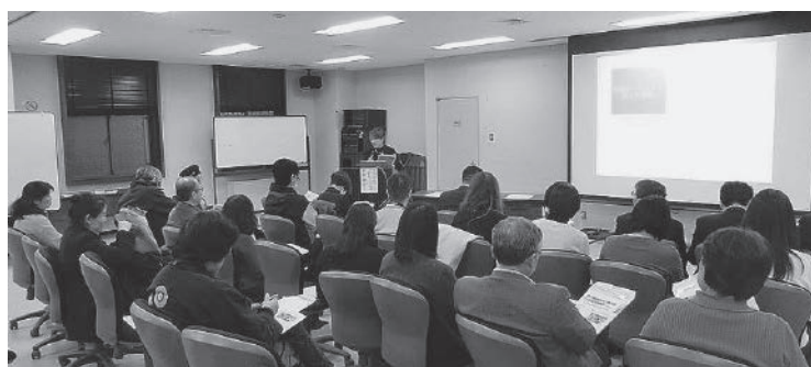
セミナーを開催しました

また活動紹介ブースでは、各団体で担当時間を分担し、大阪府森林組合が製作された2018年の台風21号で倒木被害を受けた高槻市のヒノキを材料とした木製SDGsバッジの普及と、各団体のSDGsの取り組み等について紹介しました。