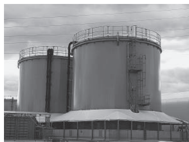
汚染水貯蔵タンク