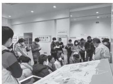
中間貯蔵工事情報センター

二日目は、双葉郡の情報発信スペース「ふたばいんふお」、東京電力廃炉資料館を見学し、東京電力の案内で、福島第一原子力発電所の構内をバスから見学し、廃炉作業の状況などについて説明を受けました。