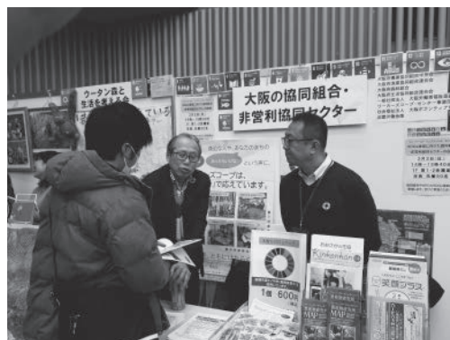
ブースで活動紹介