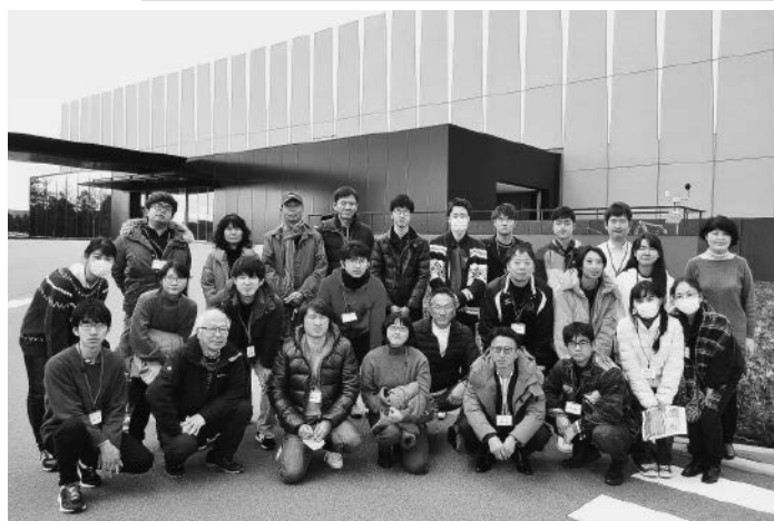
第2回東日本大震災被災地視察研修